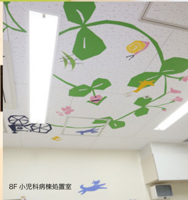
8F 小児科病棟処置室