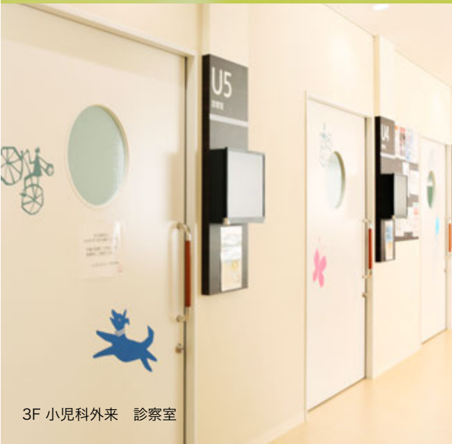
3F 小児科外来 診察室